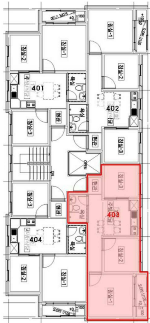
기 호 ( 가 ) ( 대경이즈뷰 4 층 403 호 )