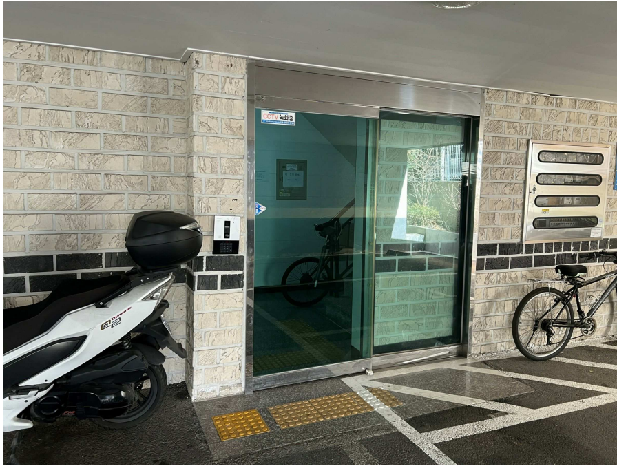
1층 출입부 현황