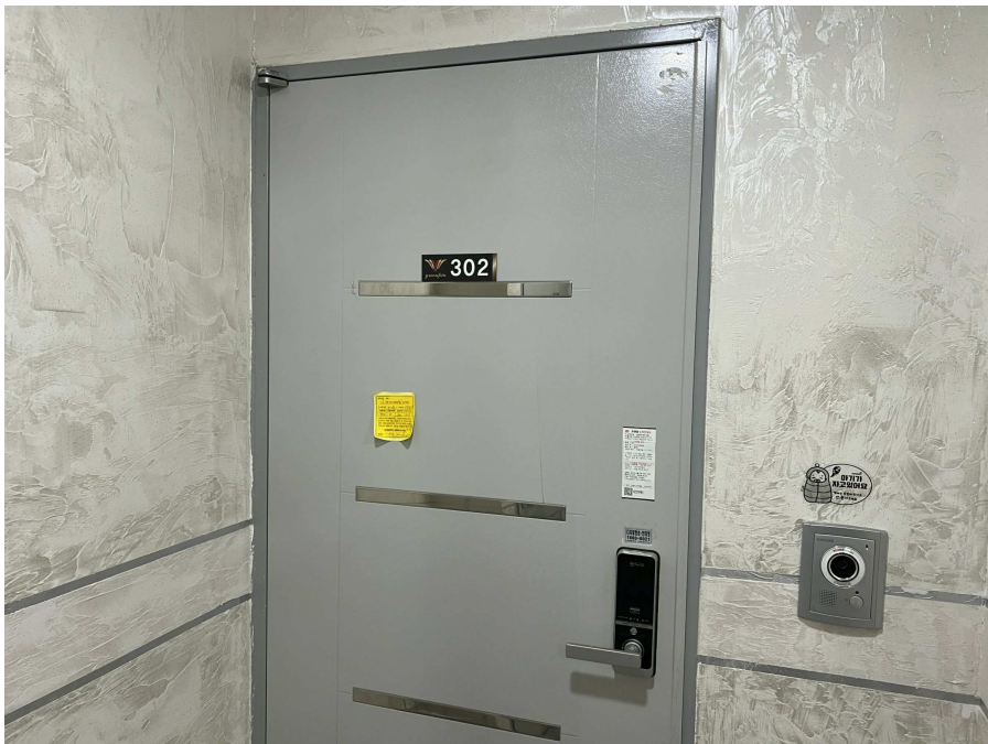
본건 외부 현황