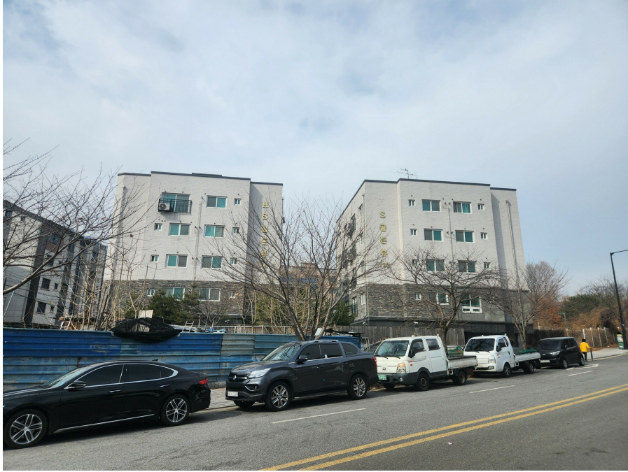
본건 단지 전경