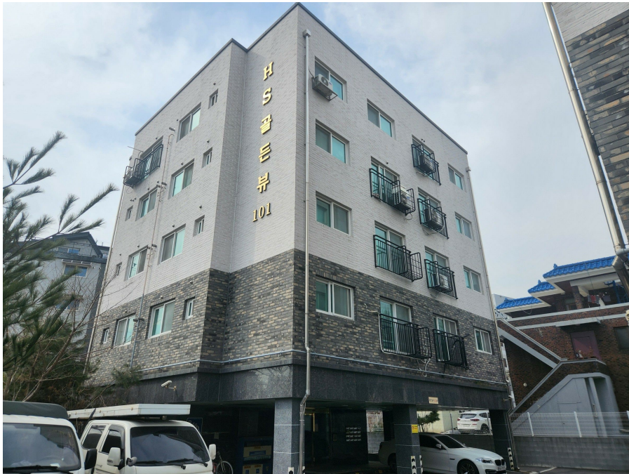
본건 동 전경