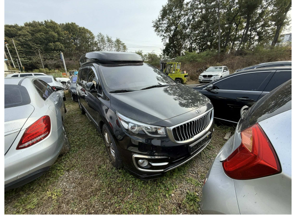
본건 외부 전경