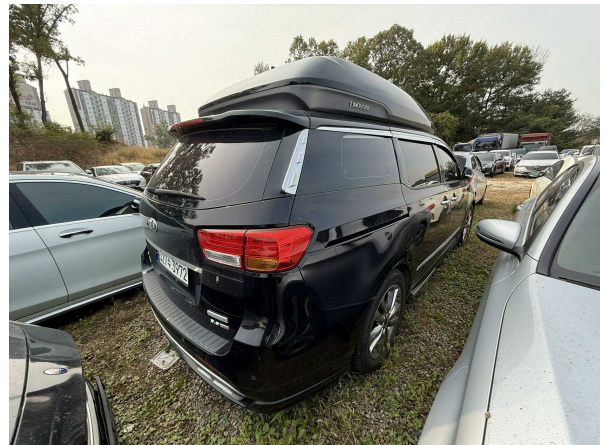
본건 외부 전경