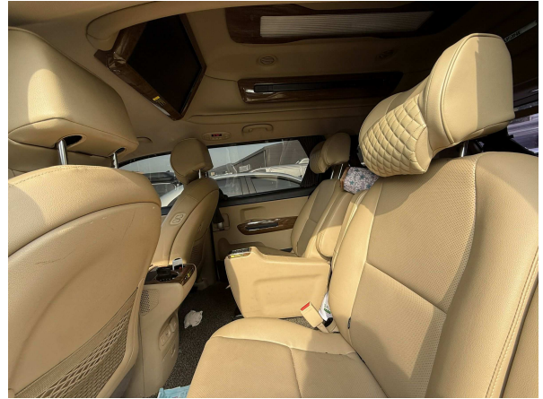
본건 내부 전경