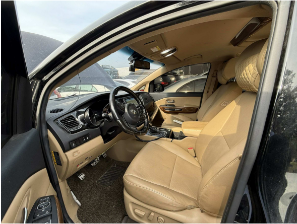
본건 내부 전경