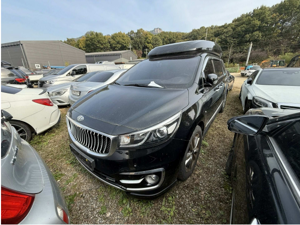
본건 외부 전경