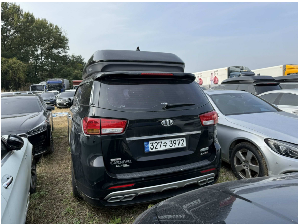
본건 외부 전경