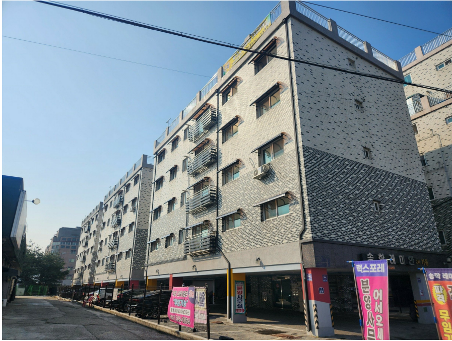
송학레미안2차 단지 전경