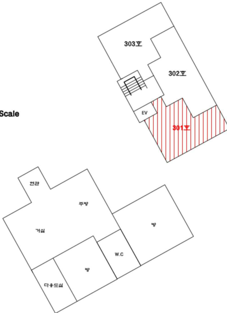
[ 내부구조도 ]