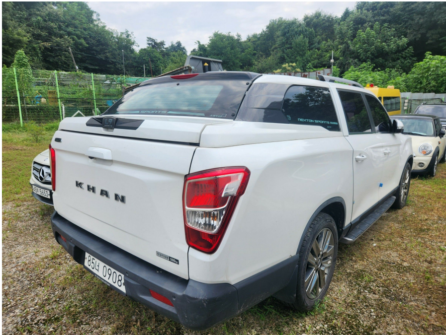
후면 및 측면 전경