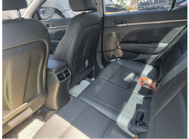
본건 내부 전경