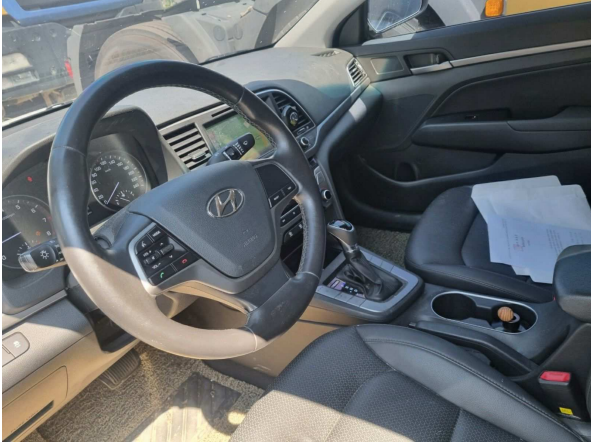
본건 내부 전경