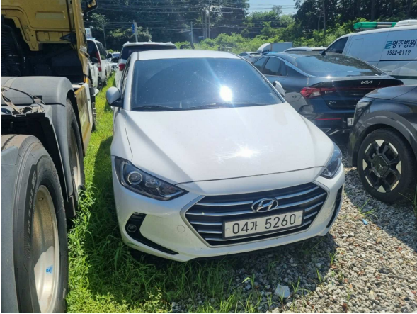
본건 외부 전경