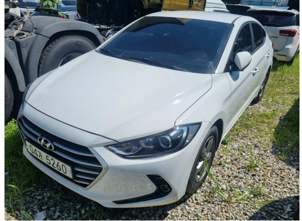
본건 외부 전경