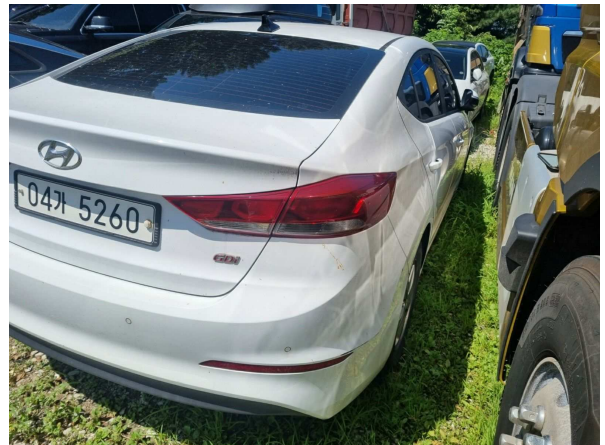
본건 외부 전경