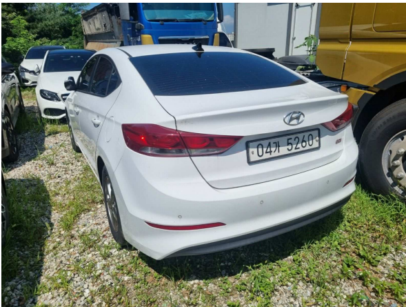
본건 외부 전경