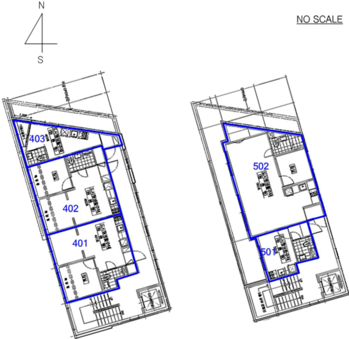
[호별배치도 및 내부구조도] [누리파크빌 101동 4층]