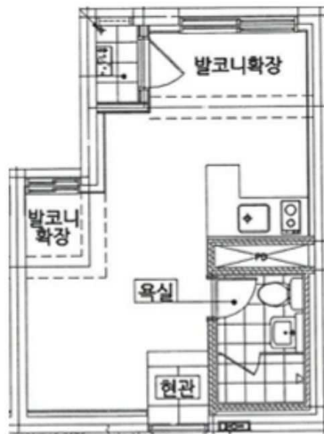
[ 내부구조도 ]