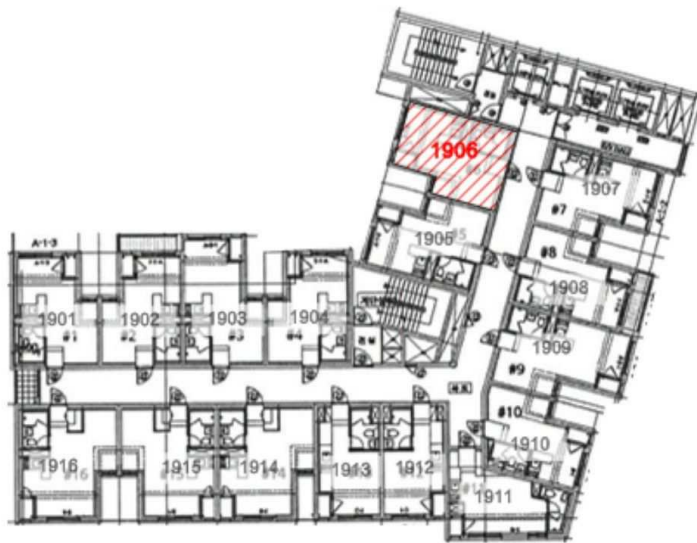
[ 19층 배치도 ]

경기도 의정부시 의정부동 184-3 의정부 한원힐트리움 더테라스 19층 1906호