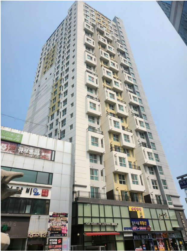
본건 동 전경