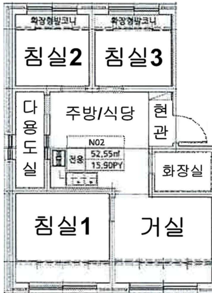
[ 기호 가 : 제4층 제402호 내부구조도 ]

※본건 내부구조는 이해관계인의 폐문 및 부재로 인하여 집합건축물대장 건축물현황도 등을 기준으로 하며, 일반적이고 표준적인 상황을 기준으로 함.