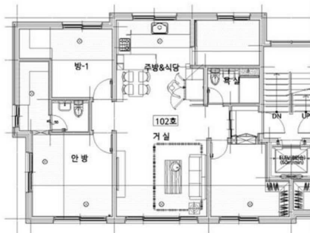
< 건축물현황도상 내부구조도 >