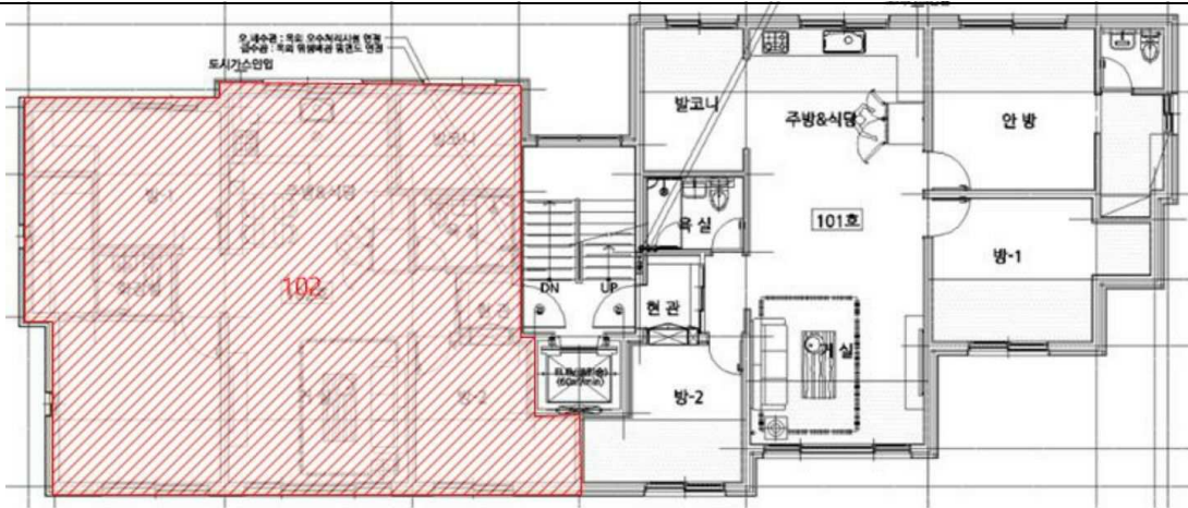
< 건축물현황도상 호별배치도 >

소재지 경기도 고양시 일산동구 풍동 605-20 에르메스2차 104동 1층 102호