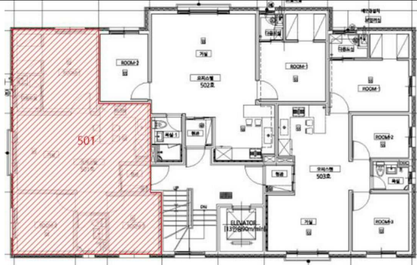
< 건축물현황도상 호별배치도 >