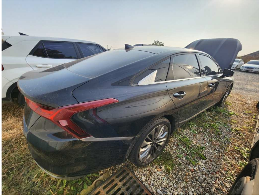
본건 우측 후면