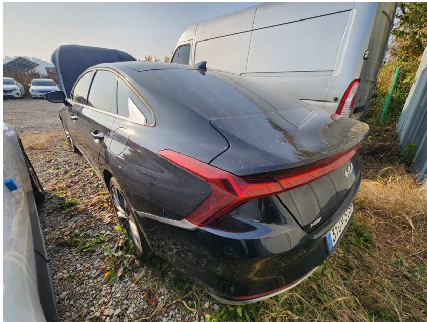
본건 좌측 후면