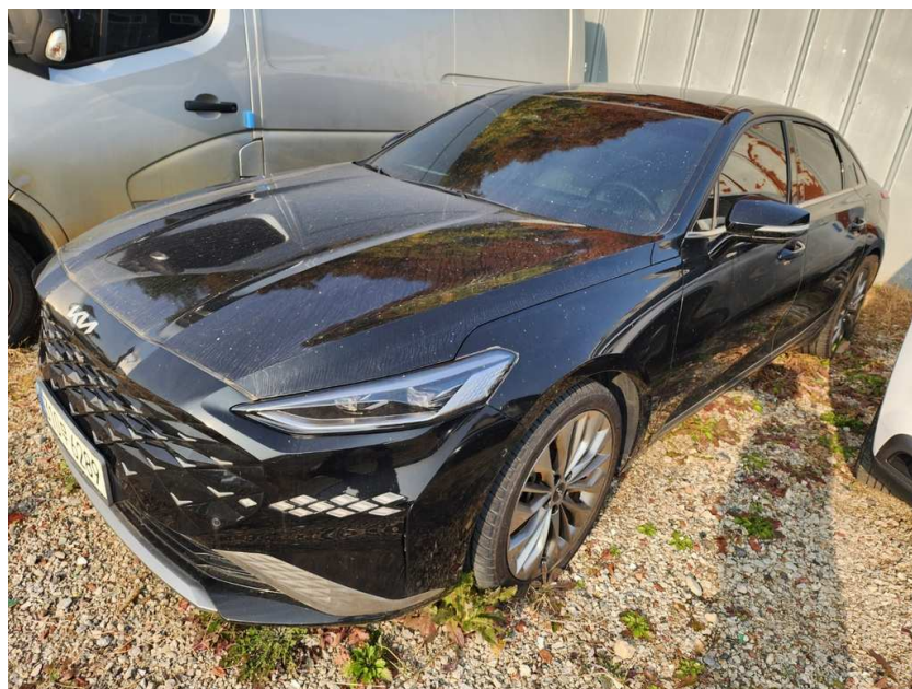
본건 좌측 정면