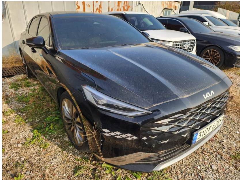
본건 우측 정면