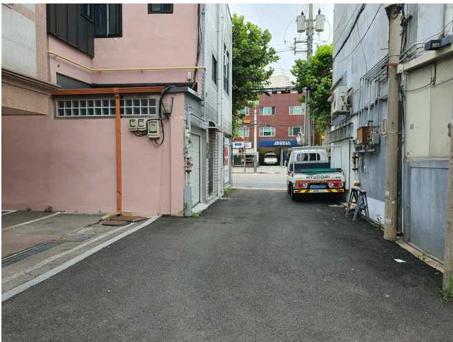
주 위 환 경