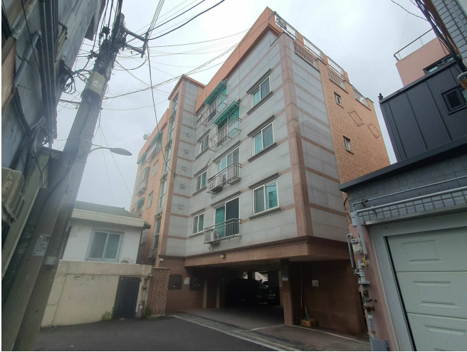
본건 건물 전경