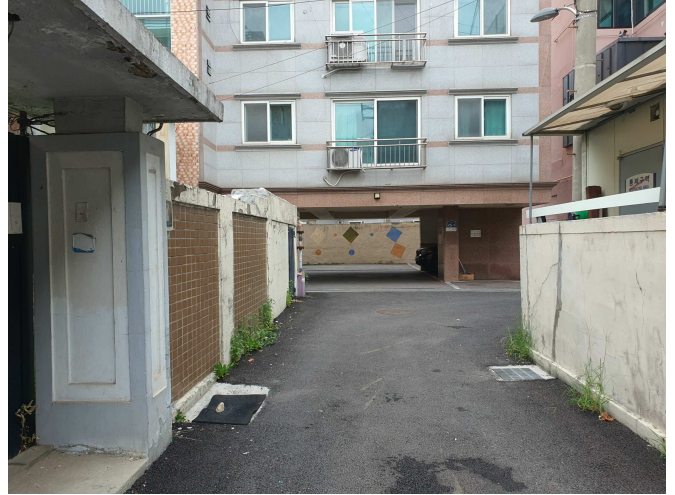
주 위 환 경