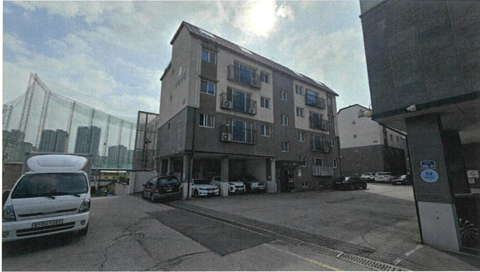
본건 및 주변 전경