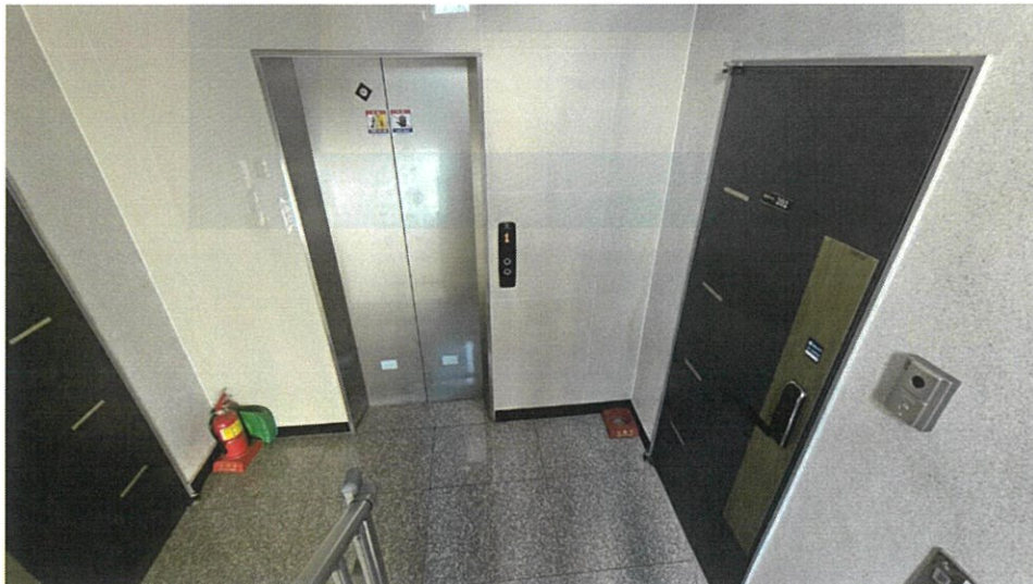
승강기 및 복도