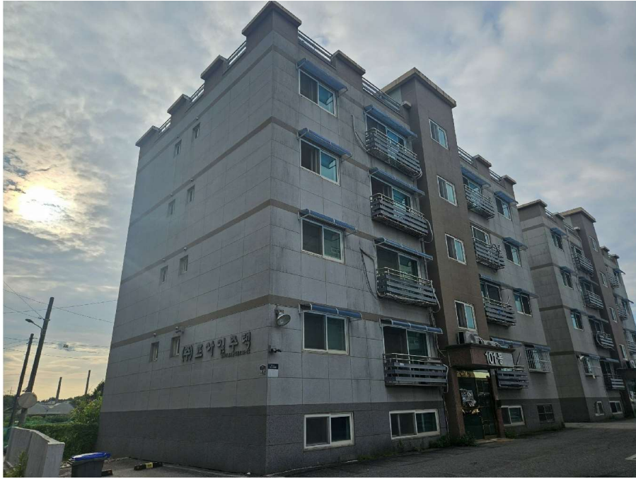
본건 전경 (남동측에서 촬영)