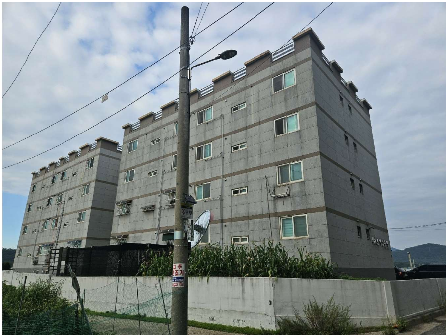
본건 전경 (남서측에서 촬영)