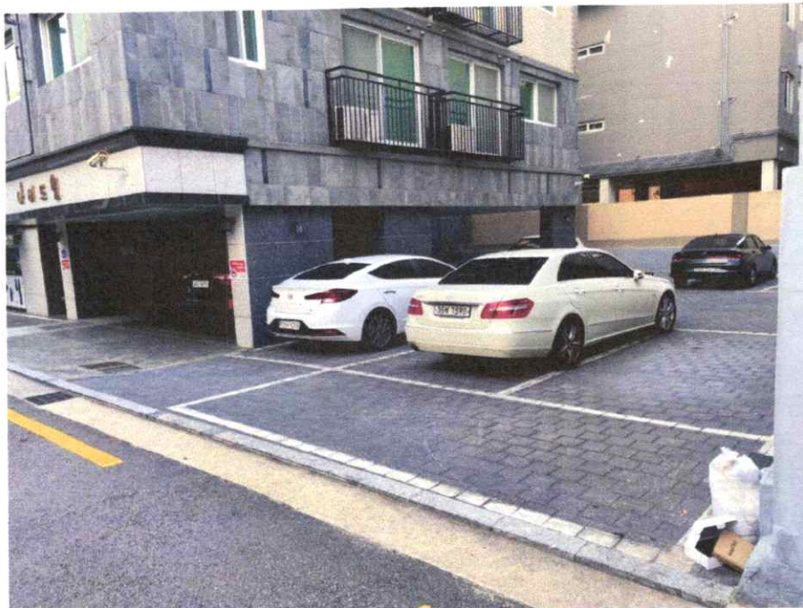
지상층 주차장 및 공용부분