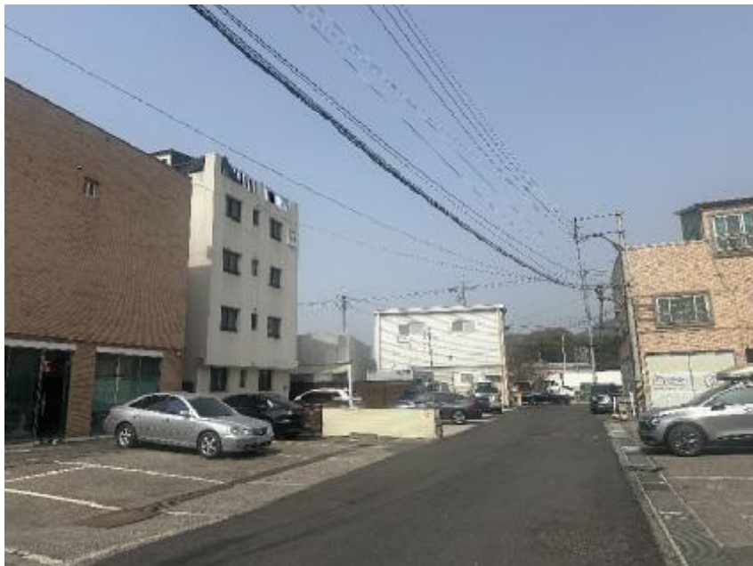
【주위전경(본건 남서측에서의 촬영)】