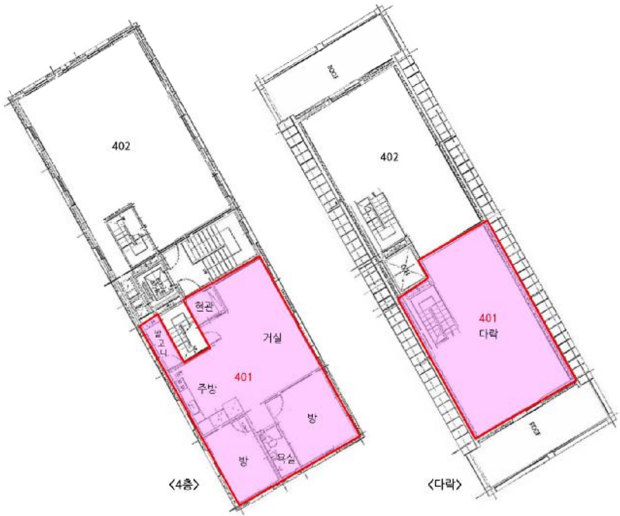
[ 제4층 호별배치도 및 제401호 내부구조도 ]