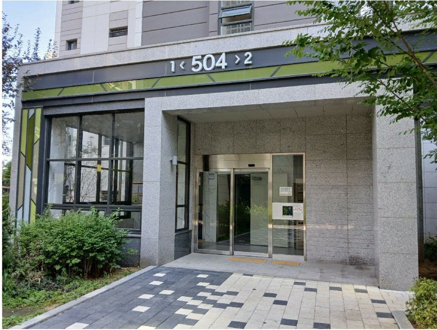
[ 504 ]