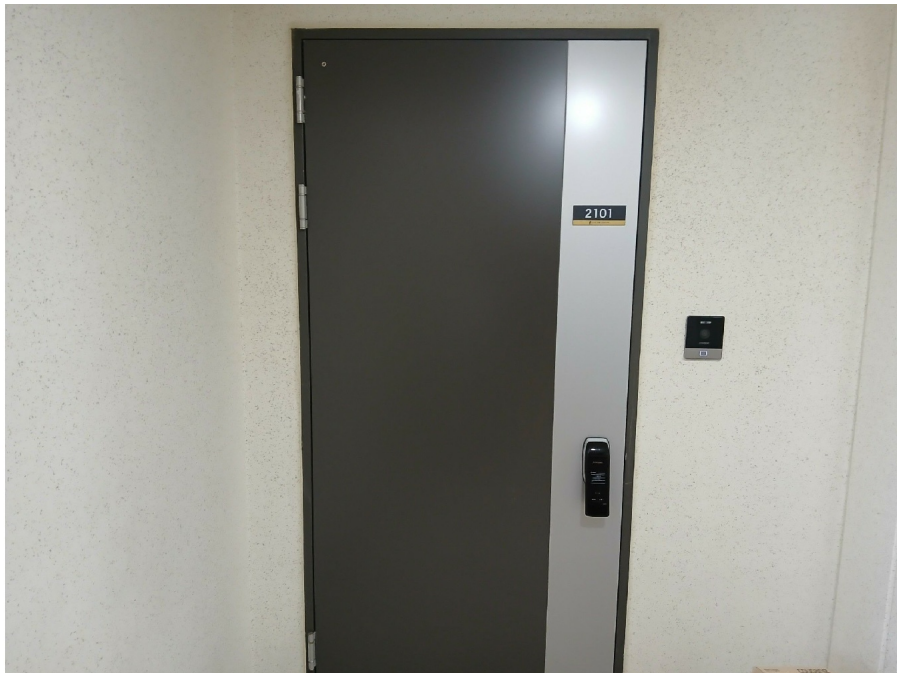
[ 2101 ]