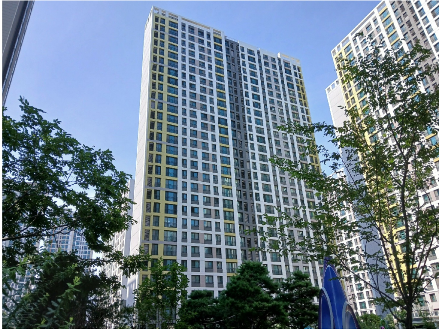
[ 504 (1) ]