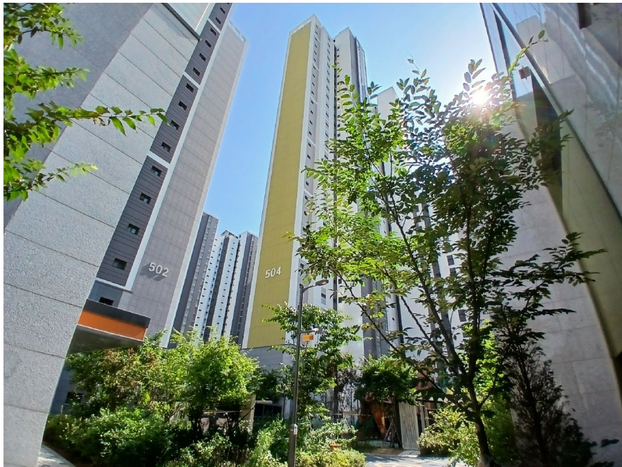
[ 504 (2) ]