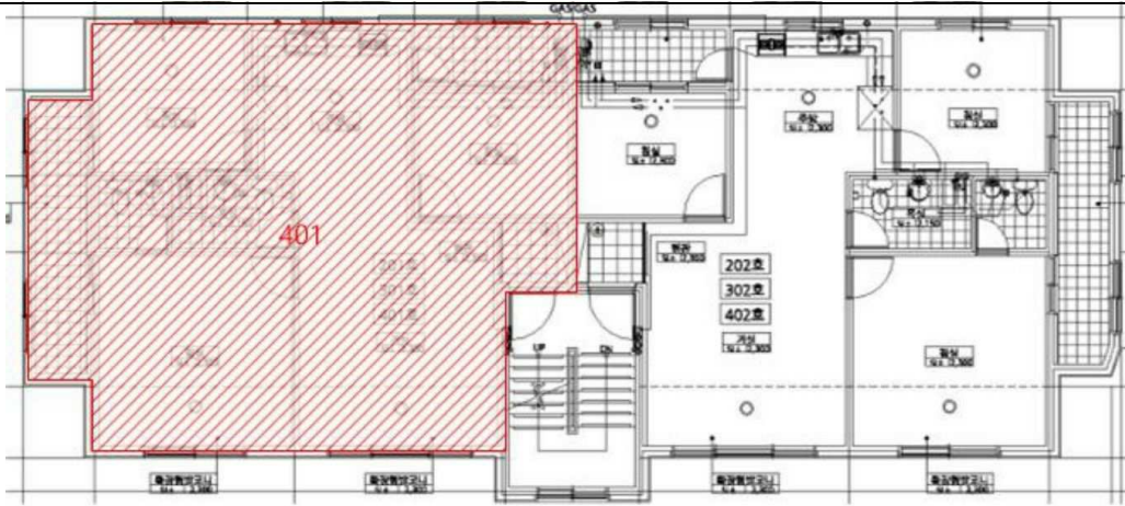
< 호별배치도 >