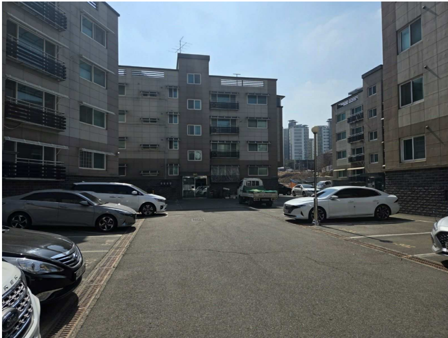
단지 내 전경