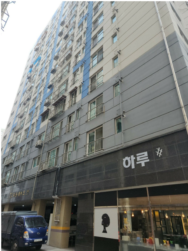
1 ( )