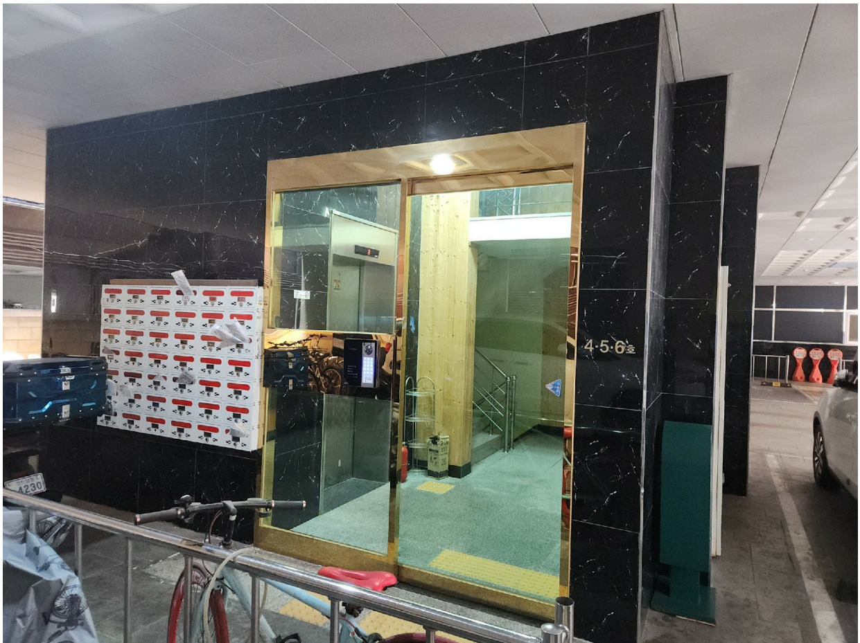
4, 5, 6