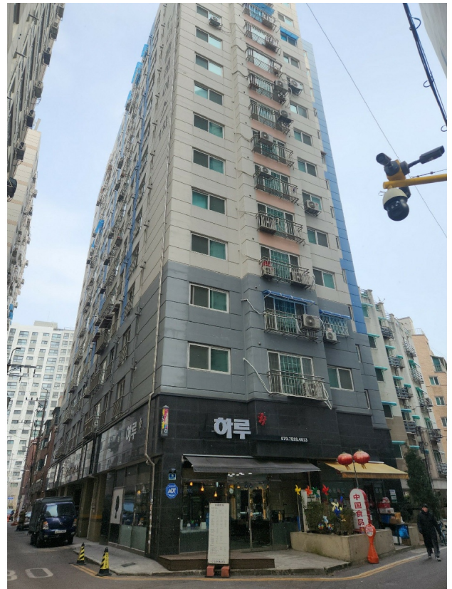
1 ( )