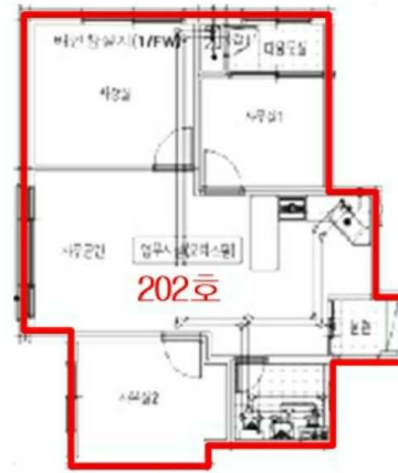
< 내부구조도 >