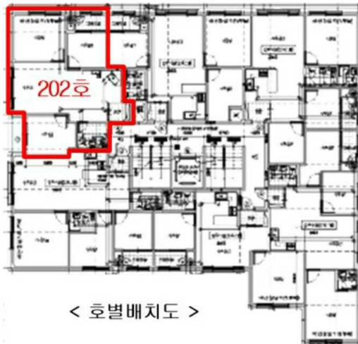
< 호별배치도 >