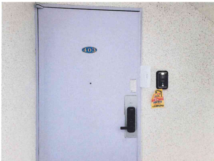
본건 출입구 사진