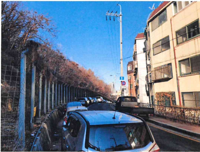
본건 주위 전경 사진