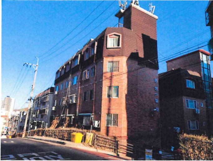
본건 건물 외관 사진