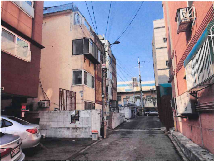
본건 북동측에서 촬영