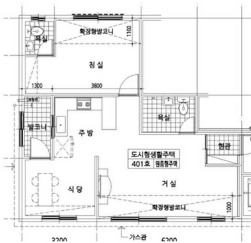
< 내부구조도 >