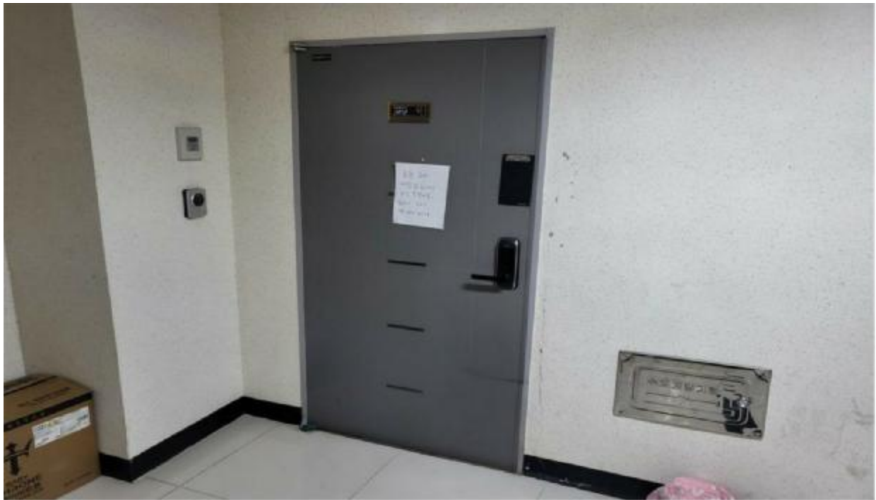
본 건 현 관