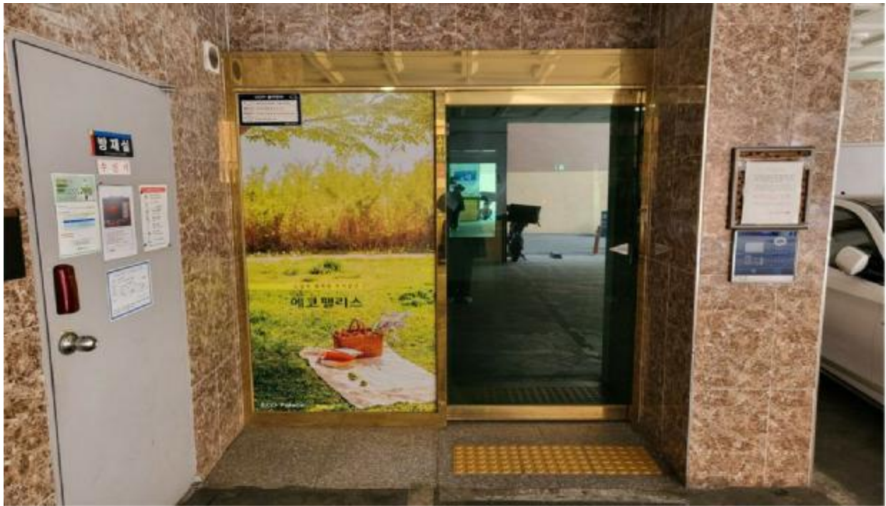
본 건 출입구