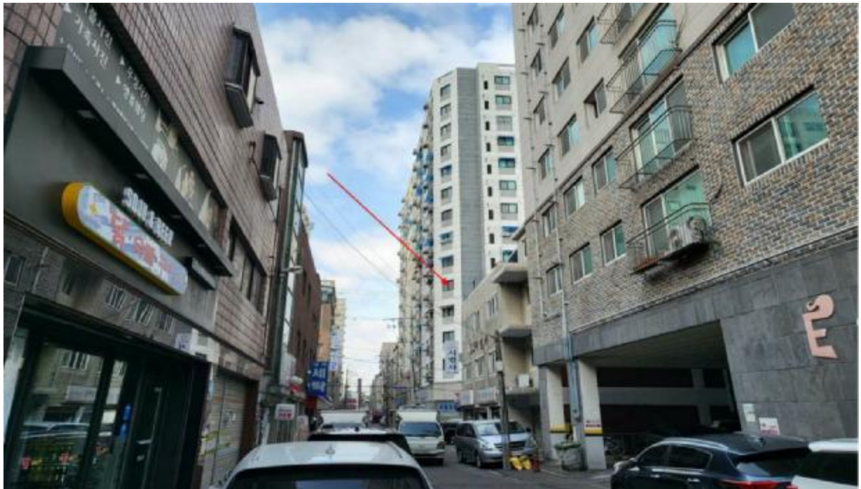
본 건 주 위