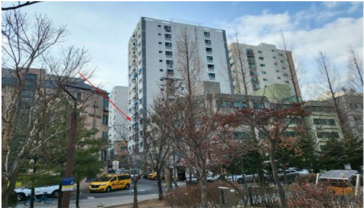
본 건 주 위