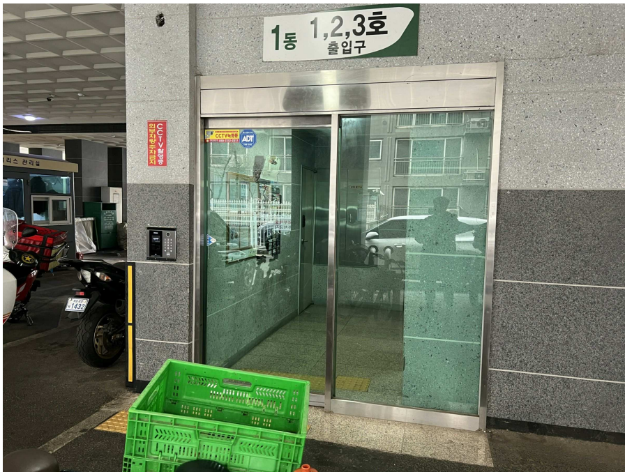
1층 출입부 현황