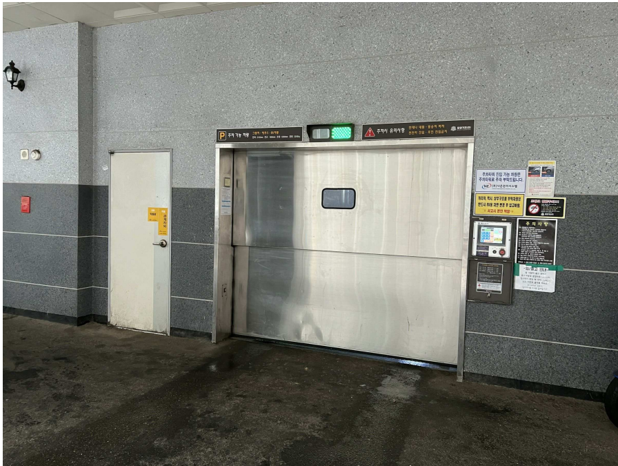
기계식 주차설비 부분