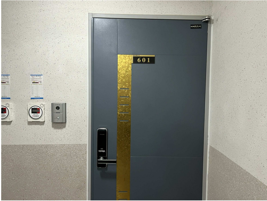
본건 외부 현황