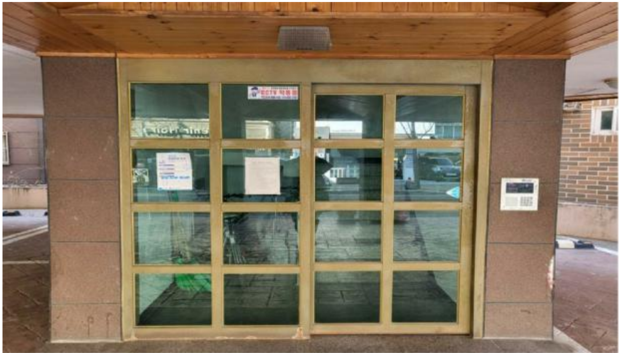
본 건 출입 구(1층)