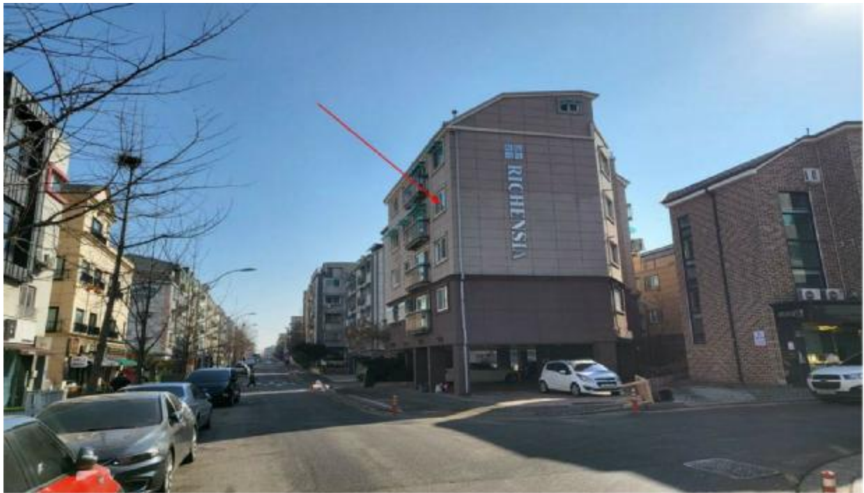
본 건 주 위