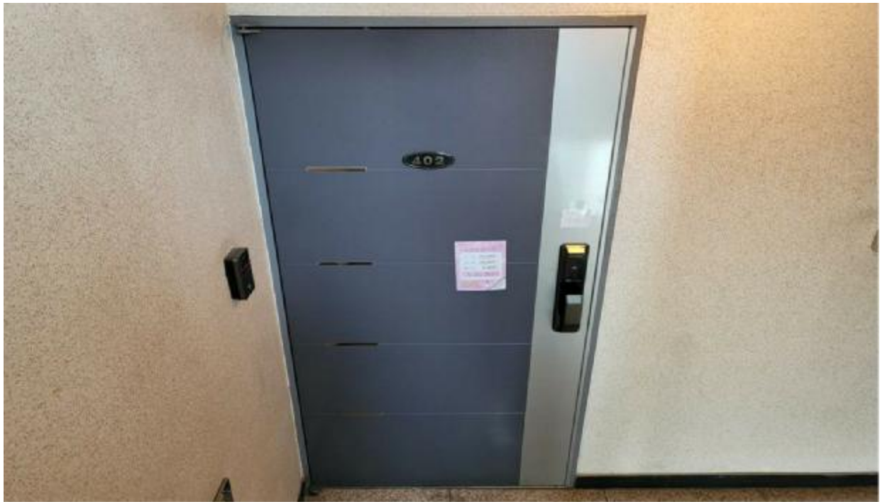
본 건 현 관