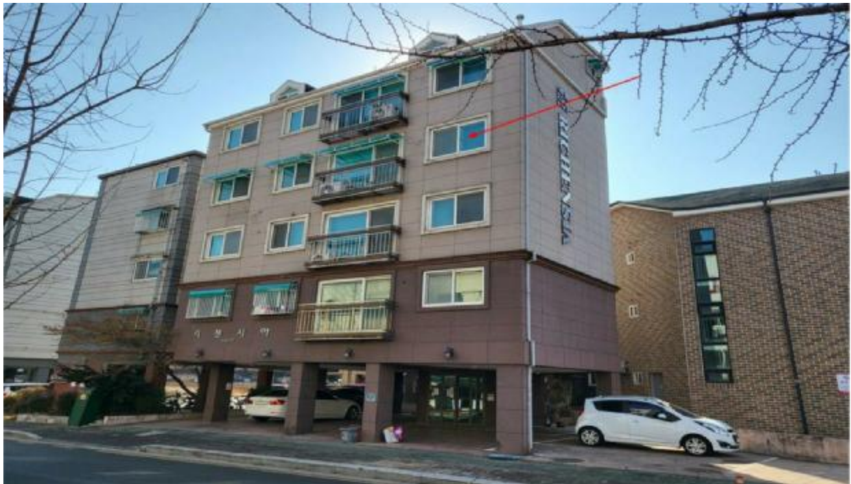
본 건 전 경