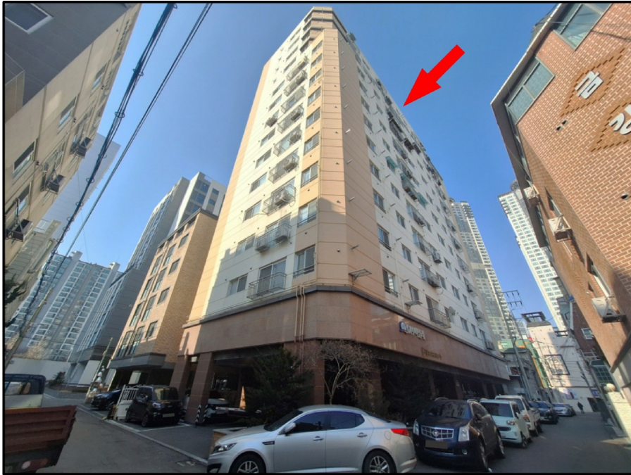
[ - ]