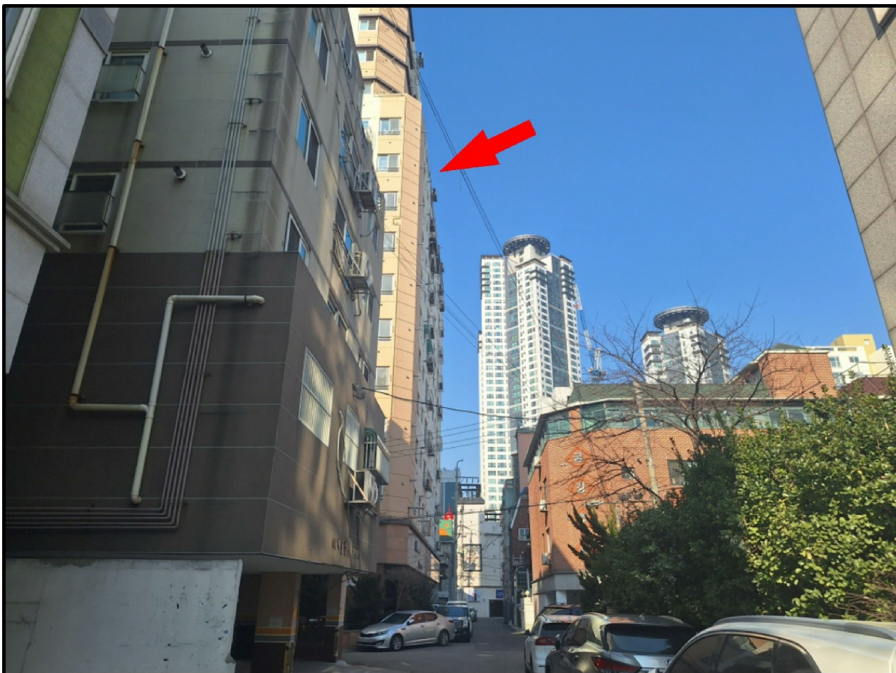
[ ( ) - ]