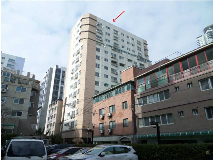
본건이 속한 건물의 전경