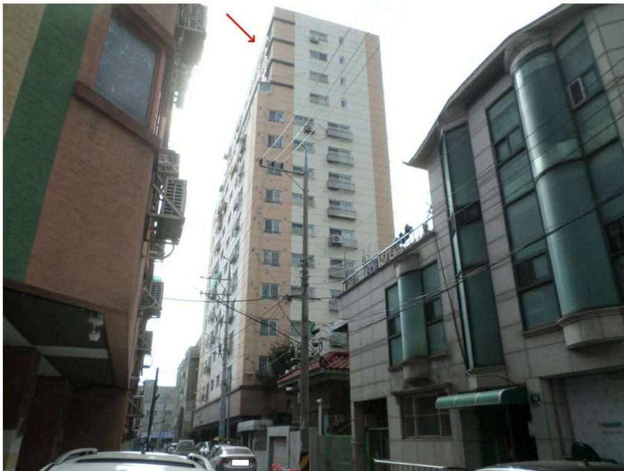
본건이 속한 건물의 전경