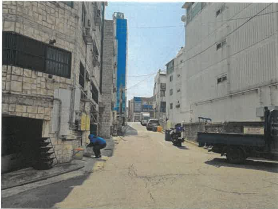
[ 주변 환경 ]