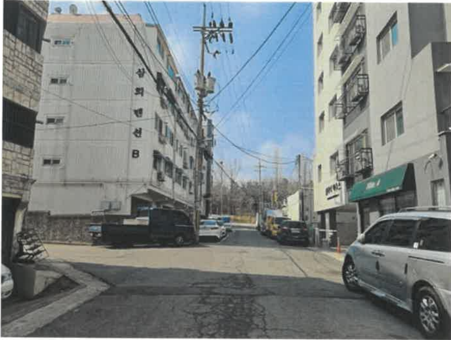
[ 주변 환경 ]