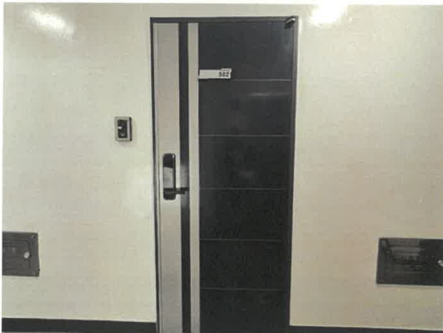
[ 본 건 현 관 ]