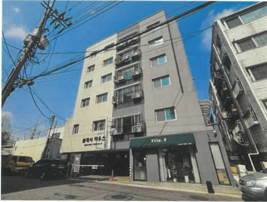
[ 본 건 전 경 ]