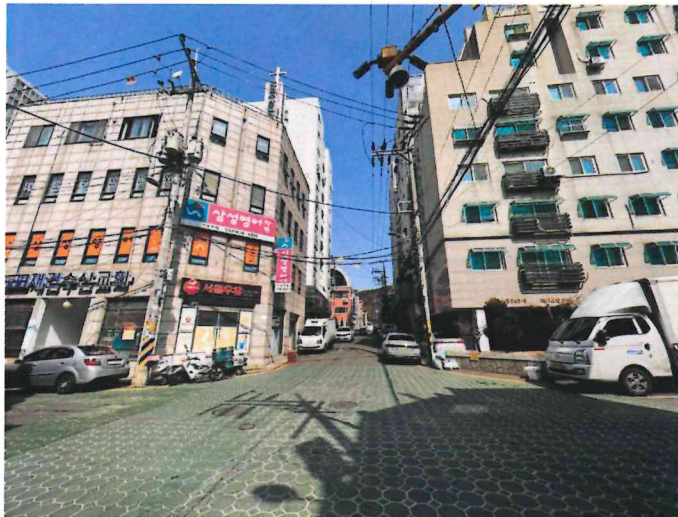
본건 남서측에서 촬영