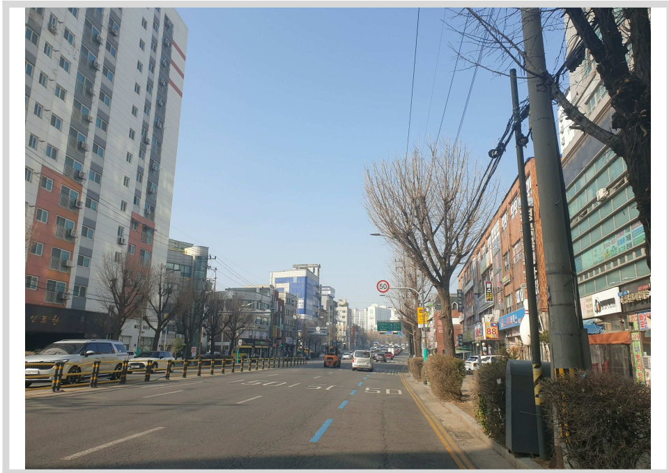
남측 접면 도로