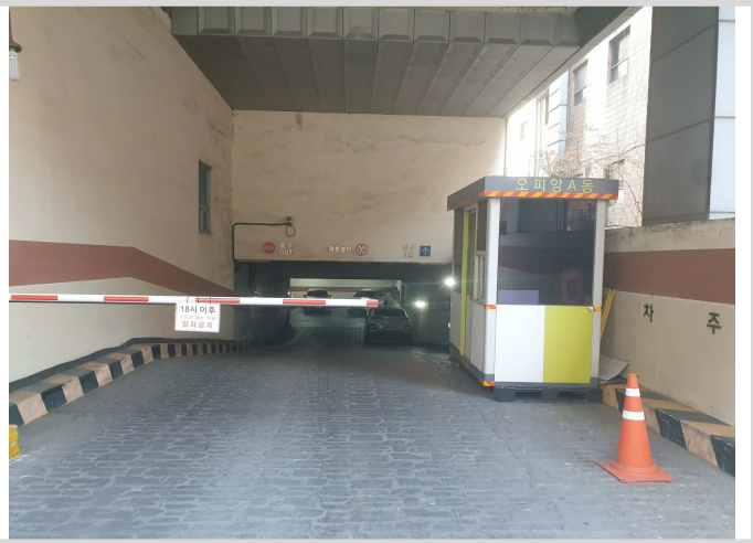
지하 주차장 진입로