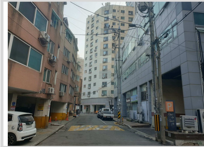
북측 접면 도로