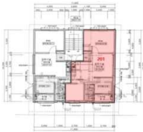
< 2층 호별배치도 >