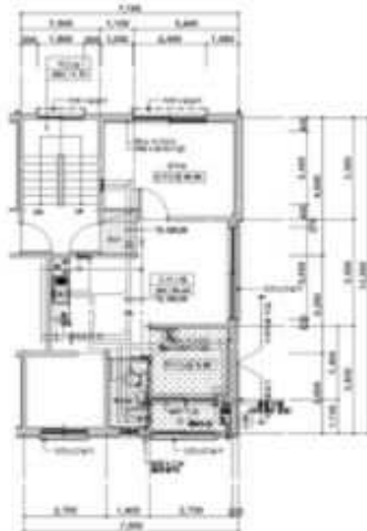
< 2층 201호 내부구조도 >