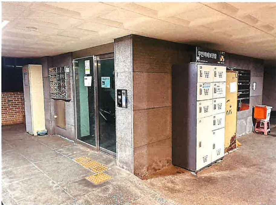
대상물건 공동 출입구