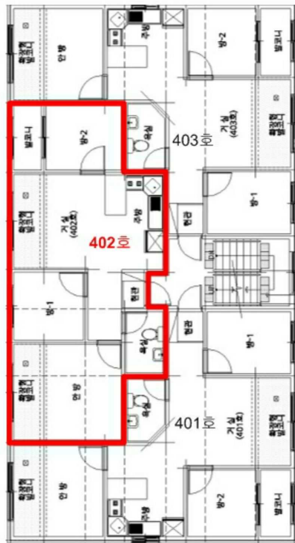
본건 [ 은빛설레임 4층 402호 ]