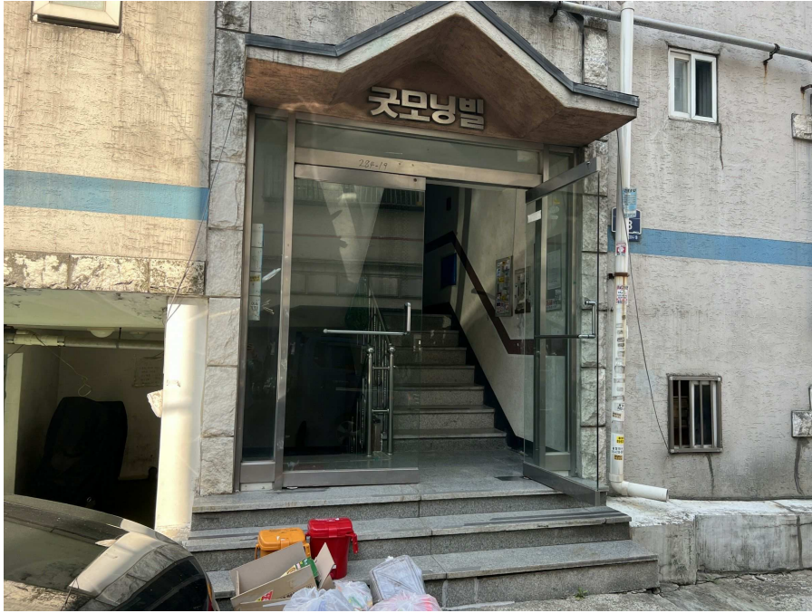
1층 출입부 부분