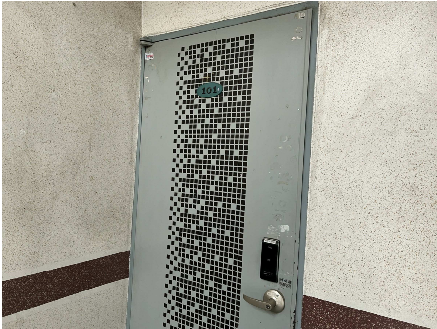
본건 외부 현황