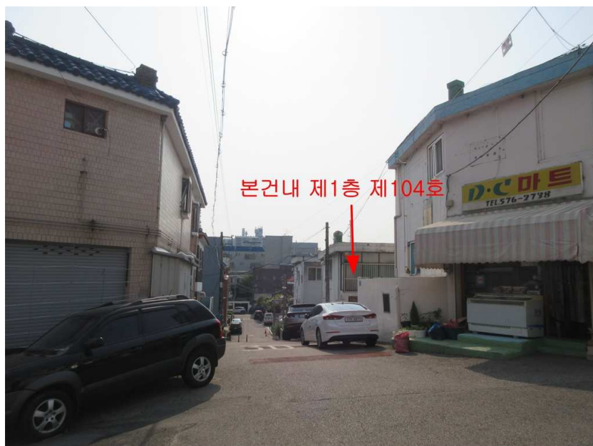
주위환경 : 본건 [북서측]에서 촬영