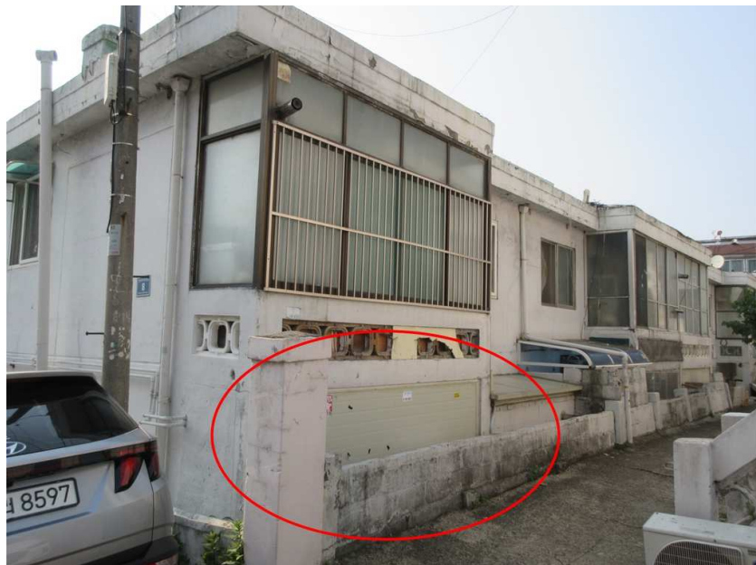
본건 전경 : 본건 [남동측]에서 촬영