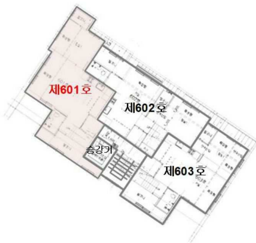
【 호별배치도(6층) 】