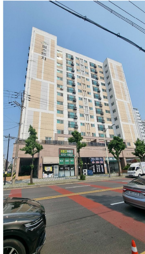
본건 소재 건물 전경