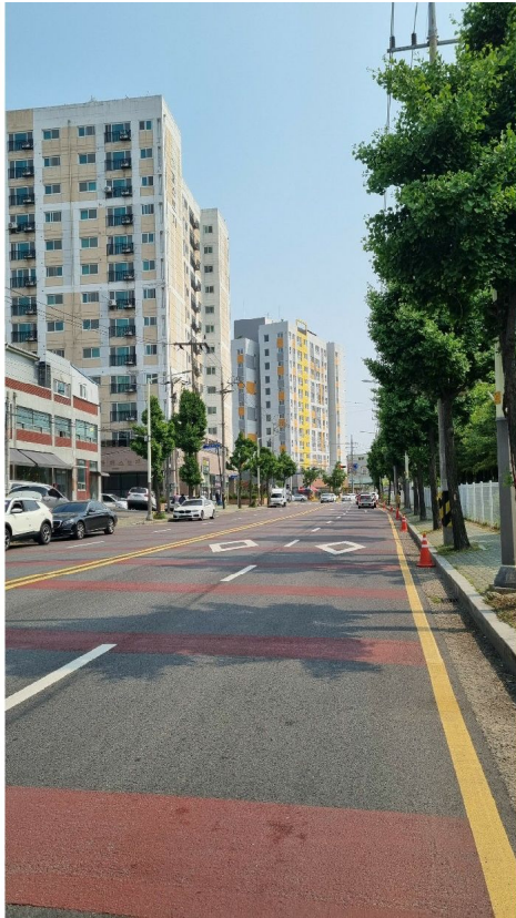
본건 주변 전경