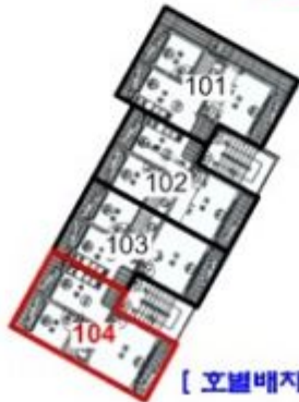
[ 호별배치도 ]