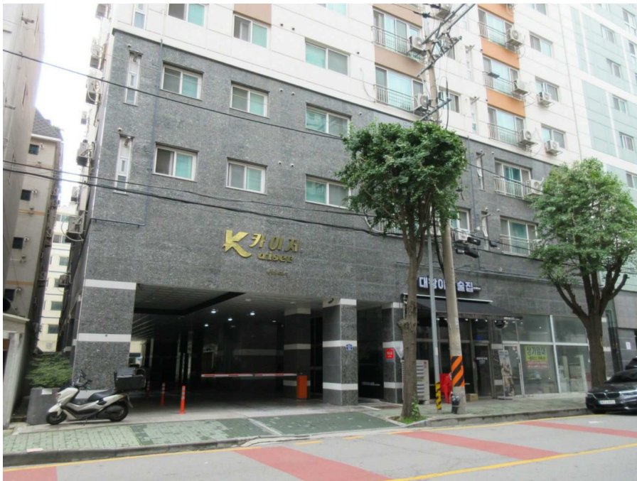
1층 출입구 전경