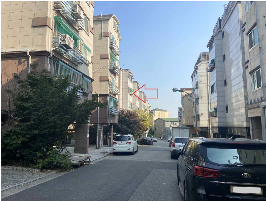
주위환경 (남서측에서 촬영)