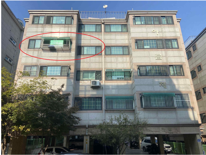
대상물건 전경 (남측에서 촬영)