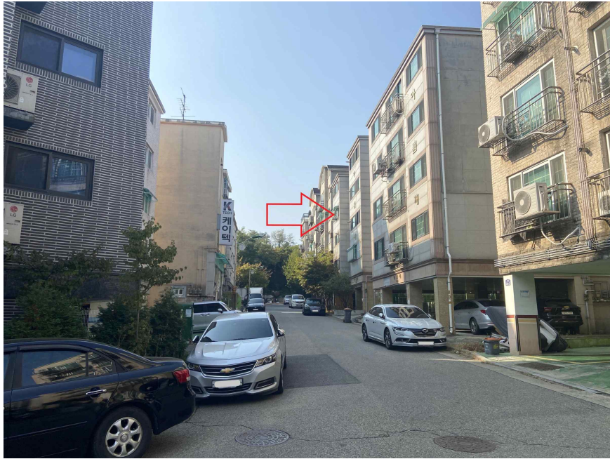
주위환경 (남동측에서 촬영)