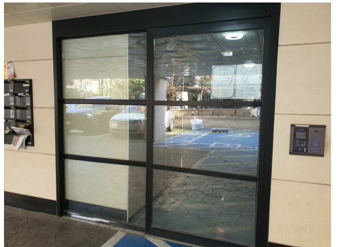
지 상 출 입 부