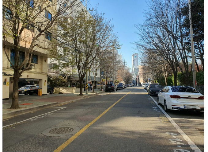
주 위 환 경