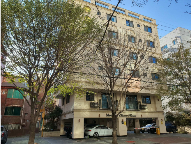
본건 건물 전경