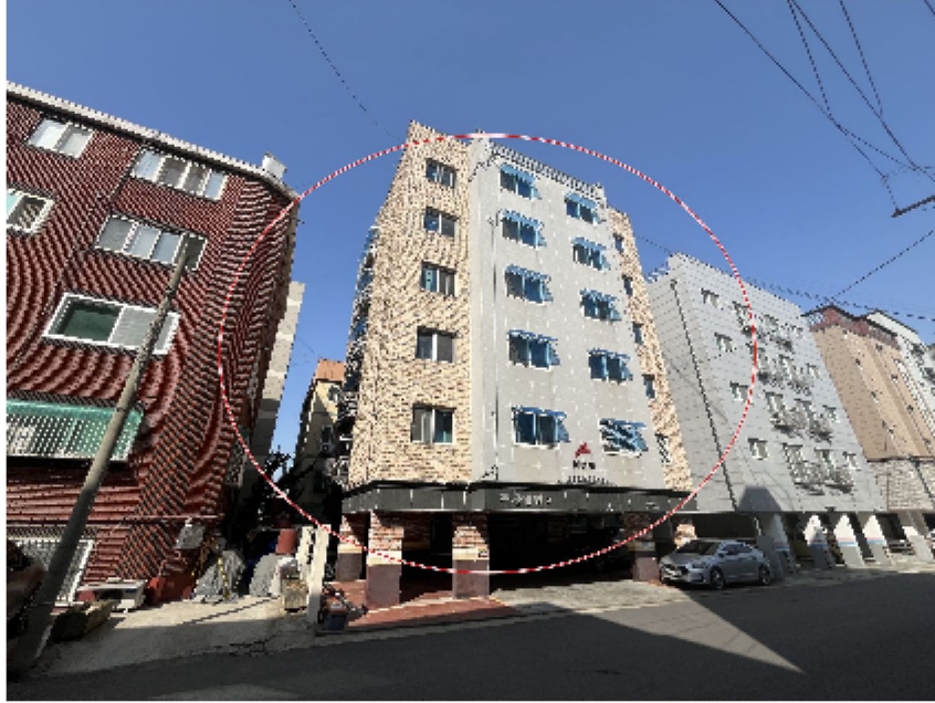
【 대상물건 】