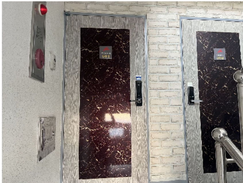
【 대상물건 】