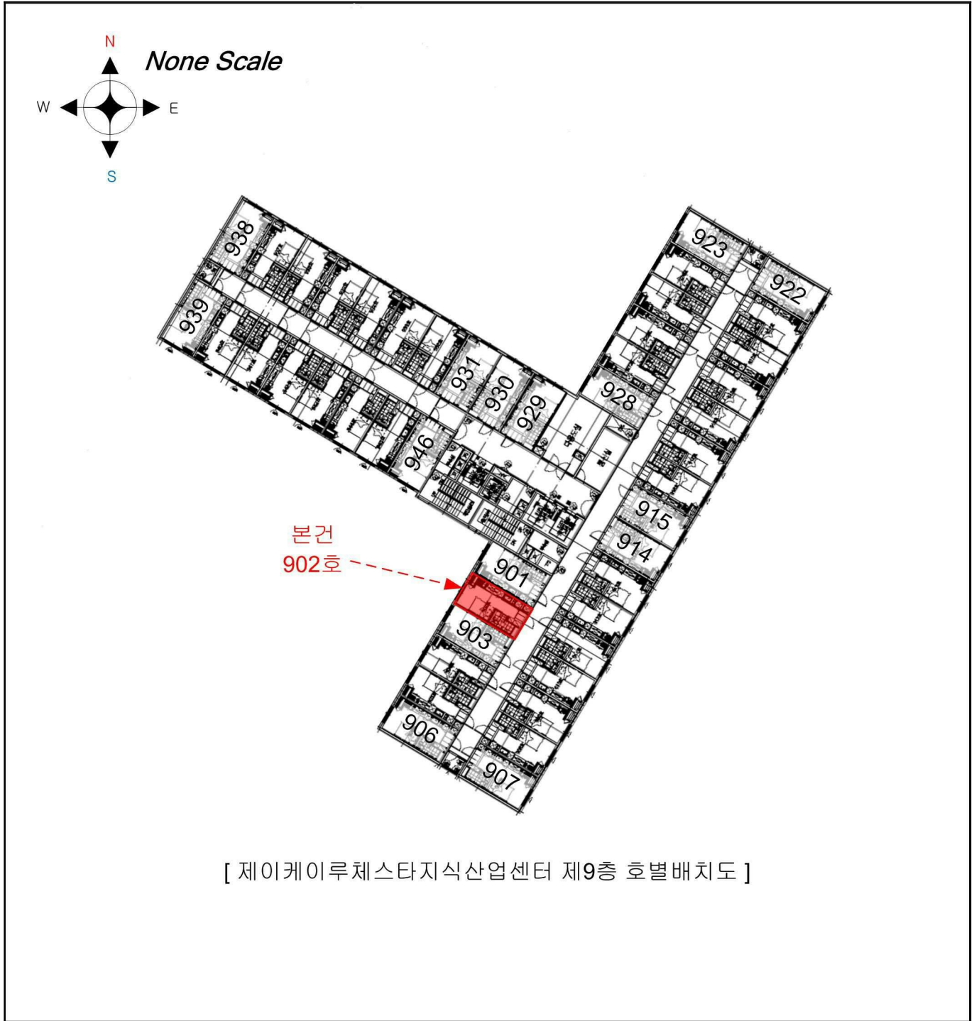
[ 제이케이루체스타지식산업센터 제9층 호별배치도 ]