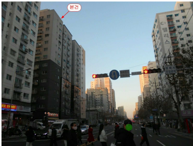
주변 전경(남동측 인근에서 촬영)