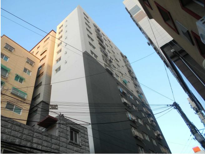
본건 전경1(남서측 인근에서 촬영)