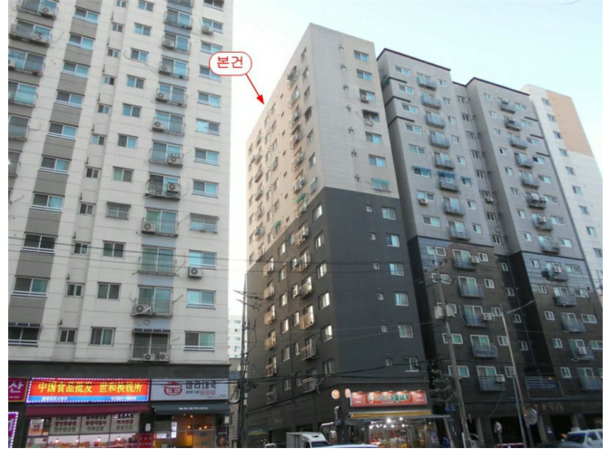
본건 전경2(남동측 인근에서 촬영)