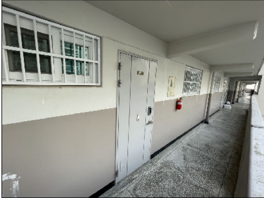
[본건 입구에서 촬영]