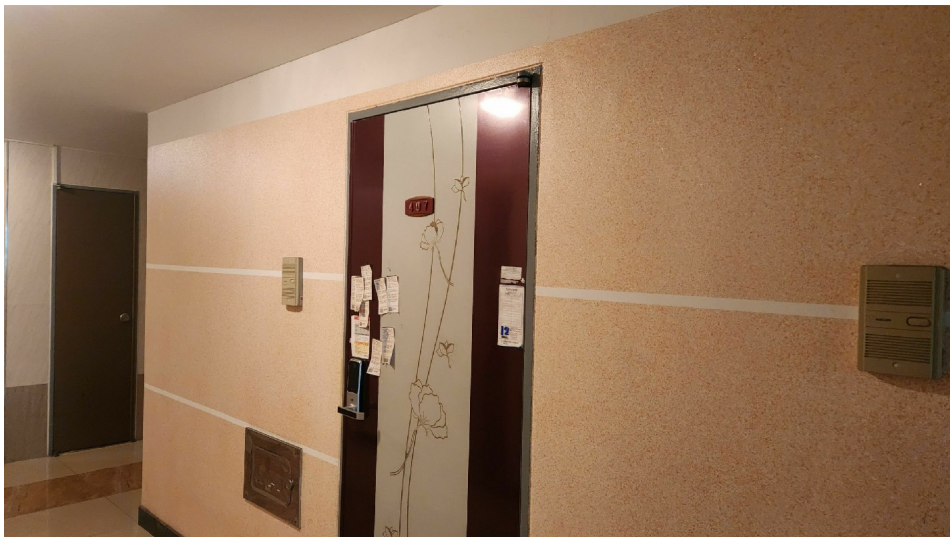
( 407 )