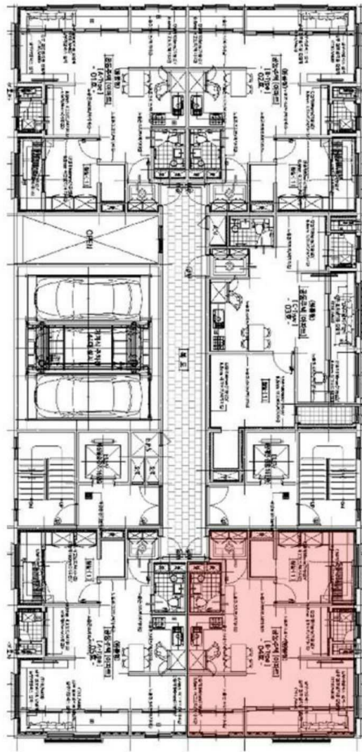
[ 호별배치도 ]

인천광역시 미추홀구 송의동 353-22 한마음아파트 에이동 7층 704호